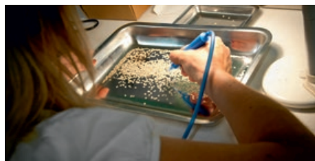
LYCÉE AGRICOLE LE VALENTIN

Néanmoins, le proviseur indique qu'« aujourd'hui, plus de 60 % des jeunes diplômés aspirent à poursuivre leurs études, la plupart du temps en licence professionnelle (LP) ». Le lycée agricole propose notamment la LP parcours « management, commercialisation et ingénierie des semences » (MCIS).