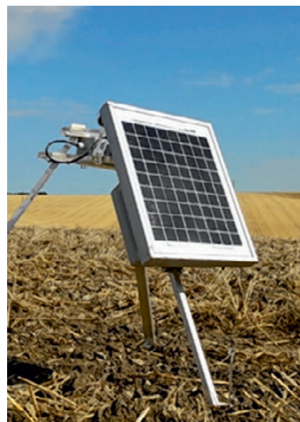
Limacapt de De Sangosse, capteur autonome et connecté, compte de façon automatisée les limaces aux champs. Il a été primé et sera présenté lors du Sima 2019.

Ce sont des métiers « classiques » pour le secteur de l'agrofour-niture, mais qui tendent à évoluer, l'entreprise se consacrant de plus en plus aux méthodes de lutte biologique à destination de tous les types de productions végétales. « Nous avons déjà des compétences dans le domaine du biocontrôle, des biofertilisants et des biostimulants, mais elles se-