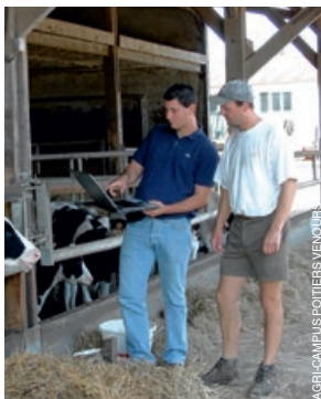
AGRI-CAMPUS POITIERS VENOURS

principalement des jeunes entre 18 et 25 ans, qui forment, avec les apprentis du CS TC en agroéquipement, un effectif d'une quinzaine d'élèves. Plus de candidats pourraient être accueillis, les besoins des entreprises étant élevés. Pendant un an, en plus des cours techniques d'approfondissement (agronomie, réglementation...), les apprentis vont travailler sur leur savoir-être, apprendre à être bien à l'écoute du client, à comprendre ses attentes, à construire un argumentaire de vente... Une fois leur diplôme obtenu, les élèves intègrent généralement leur entreprise d'accueil. « Ils évoluent dans deux types de fonction : soit celle de conseiller vendeur en magasin, en dépôt, responsable de silo, soit ils sont sur le terrain en tant que TC », explique la coordinatrice. Certains deviennent des TC spécialisés dans le conseil dématérialisé (outil d'aide à la décision...). Depuis plusieurs années, cette fonction joue un rôle de plus en plus prépondérant.