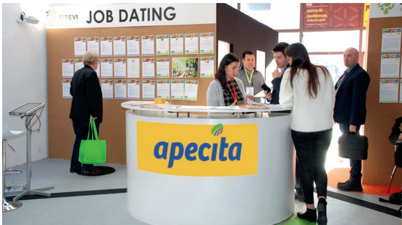
L'Apecita organise également des Job dating lors de Salons professionnels ou d'opérations spécifiques.

L'objectif principal de l'Apecita est de favoriser la rencontre des employeurs avec des personnes à la recherche d'un emploi. À cette fin, l'association accompagne les entreprises dans leur recrutement, conseille et oriente les candidats. Gros plan sur les services proposés.